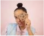
Auf ein Wort: Ich vs. Wir wurde jünger ein Jahr alt, und was für ein Jahr es war. Vielleicht das Schönste seit Bestehen von Kettcar. Die größten Konzerten, der...